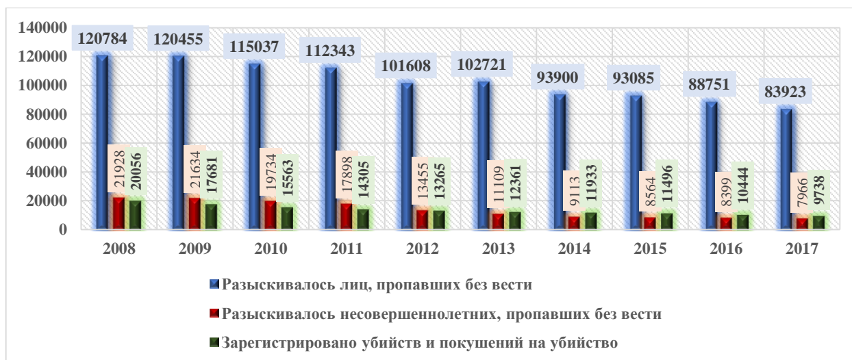
Рис. 1. Динамика числа разыскиваемых лиц, пропавших без вести, и количества зарегистрированных убийств в 2008–2017 гг.

соответствующих показателей в других государствах. Между тем, и оно вовсе не адекватно отражает реальное положение дел. Существует целый ряд явлений, количественная мера которых, в сопоставлении со статистикой убийств может существенно приблизить наши представления о масштабах этой категории преступности к реальным. В качестве таких дополнительных источников информации следует учитывать показатели лиц, погибших от преступлений, медицинскую статистику, отражающую случаи криминального насилия, собираемые органами здравоохранения, а также данные официальной уголовной статистики о числе без вести пропавших граждан и неопознанных трупах. Однако к разряду масштабных и достаточно трудоемких относится вопрос о соотношении убийств с показателями о числе без вести пропавших граждан и неопознанных трупов. Несмотря на это, полагаем необходимым обратиться к анализу показателей уголовной статистики о числе без вести пропавших граждан и неопознанных трупах, поскольку в научной литературе многократно указывая на проблемы регистрации убийств в правоохранительных органах и упоминали о возможности установления десятка тысяч латентных убийств посредством изучения материалов по неопознанным трупам и без вести пропавшим лицам (рис. 1).